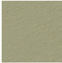
A 262 camel