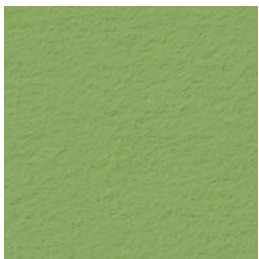
A 268 avocado