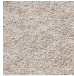
A 263 quartz