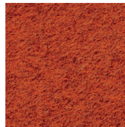
A 271 fire