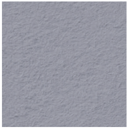
A 260 dust