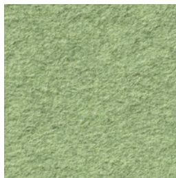
A 269 jungle