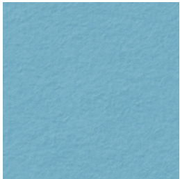
A 264 glacier