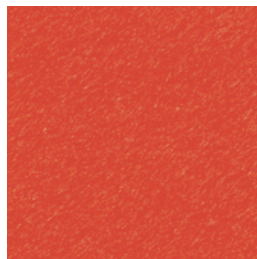
A 270 tomato