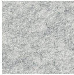
A 261 granite