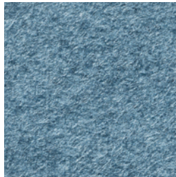
A 265 jeans