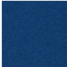
A 266 ink