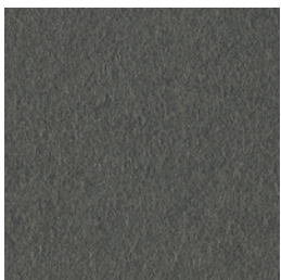
A 291 north sea